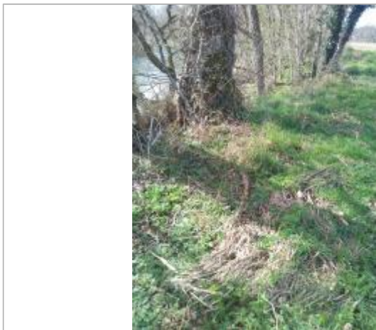
Débris végétaux au sol