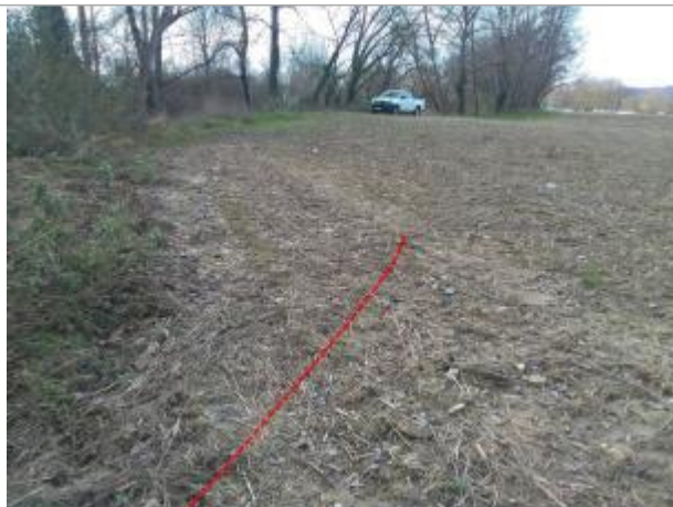
Haut de berge gravière - Photo ©AGERIN