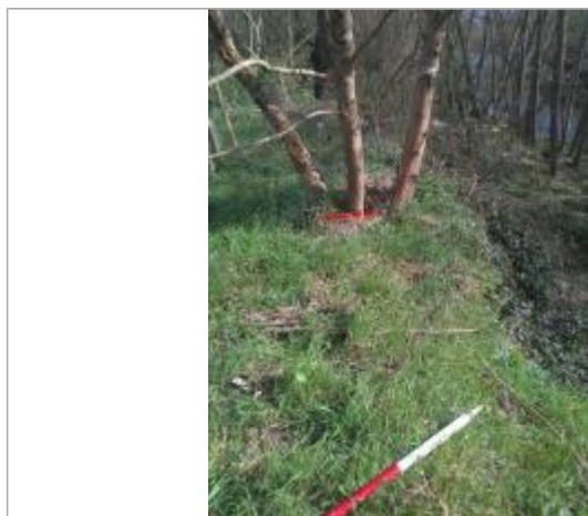
Débris végétaux au sol - Photo ©AGERIN