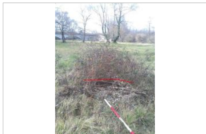
Débris végétaux sur végétation