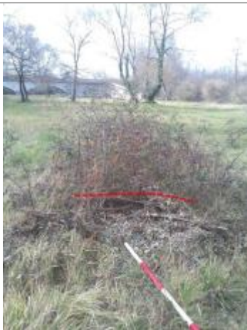
Débris végétaux sur végétation