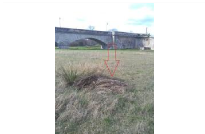
Débris végétaux sur végétation

GÉNÉRAL Code : GTL_R_9936_1 Date de mise à jour : 20/09/2020 Auteur : SPC GTL