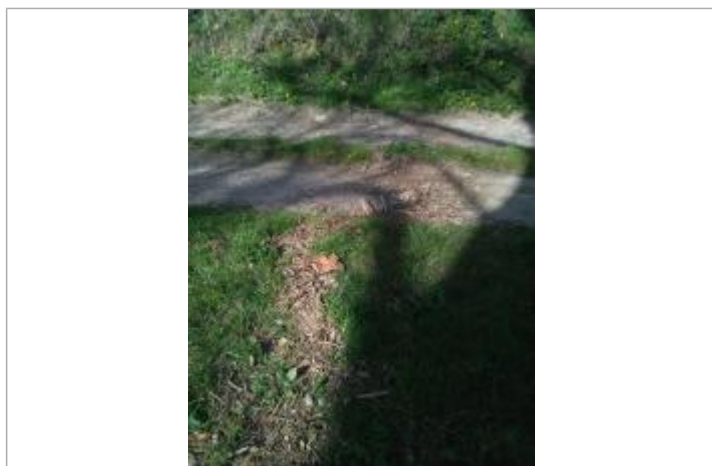
Débris végétaux au sol - Photo ©AGERIN

Altitude calculée de l'eau (en m) : 303.55 m