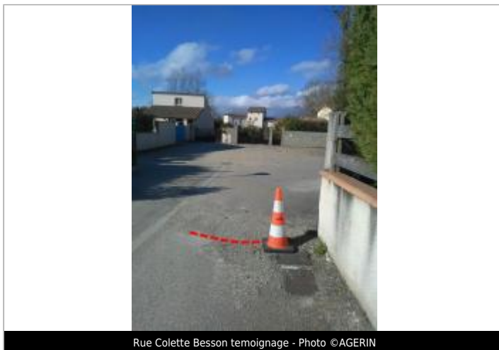
Rue Colette Besson témoignage