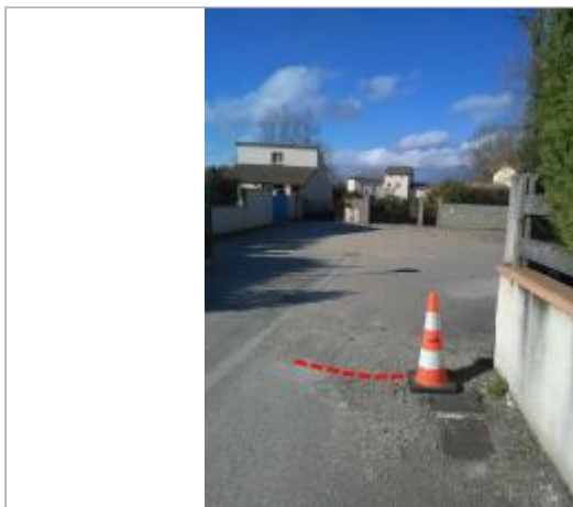
Rue Colette Besson témoignage