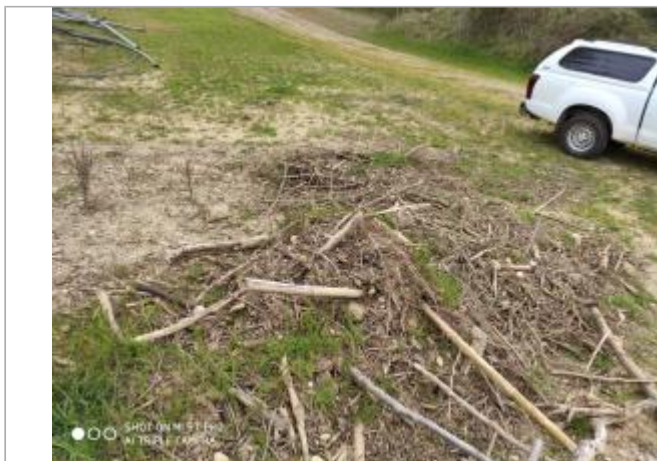
Chemin sablière de Mondoune

Coordonnées WGS84 : X: 1.80335632 / Y: 43.08037070