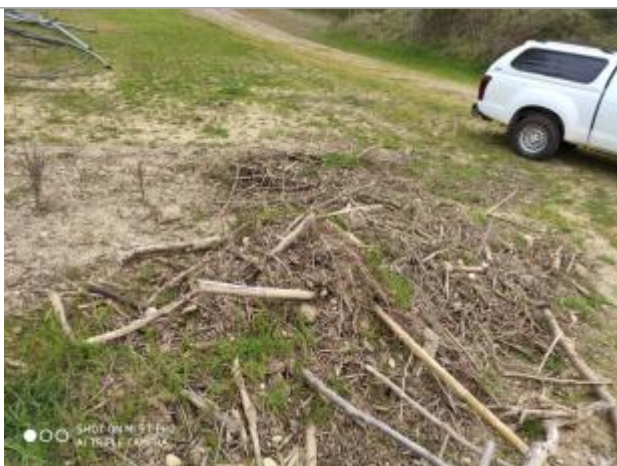
Débris végétaux au sol

Altitude calculée de l'eau (en m) : 276.91 m