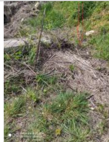
Route de Vals - Photo © AGERIN