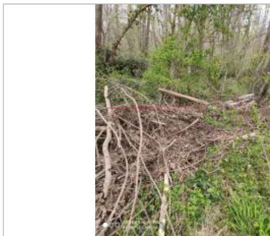
Laisse d'inondation dans des végétaux