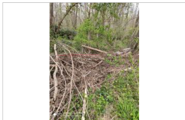
Laisse d'inondation dans des végétaux