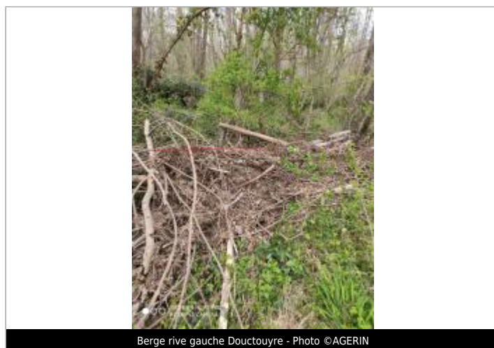
Berge rive gauche Douctouyre