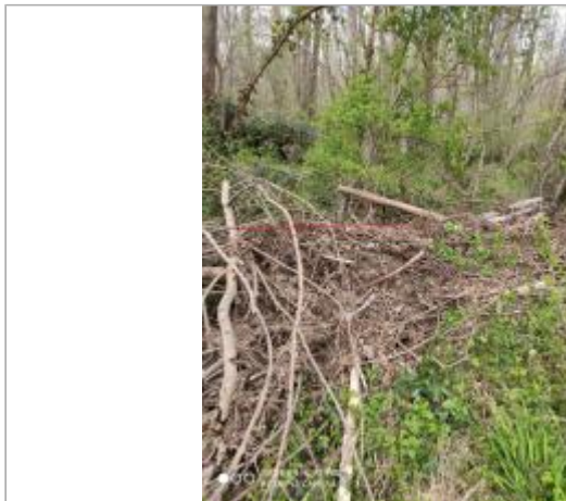
Berge rive gauche Douctouyre - Photo ©AGERIN

Coordonnées WGS84 : X: 1.75484303 / Y: 43.08951270