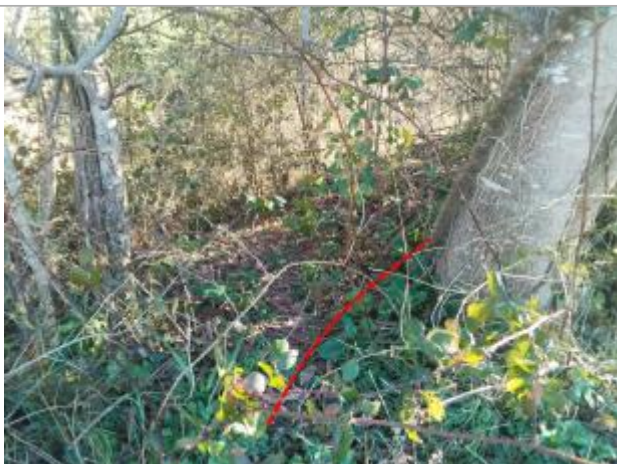
Débris végétaux en haut de talus

Altitude calculée de l'eau (en m) : 327.3 m