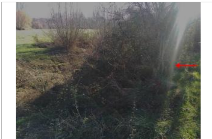
Végétation au bord de la D207