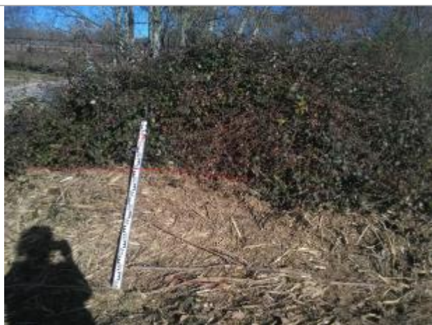
Laisse de crue dans la végétation

Altitude calculée de l'eau (en m) : 326.64 m