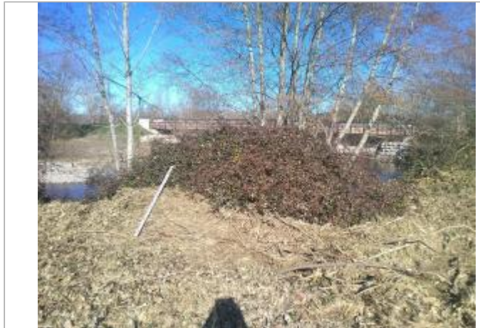
Amont du pont D207 - Photo ©AGERIN