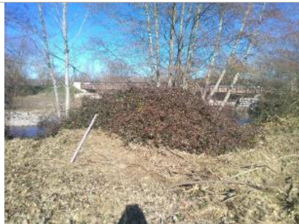
Amont du pont D207