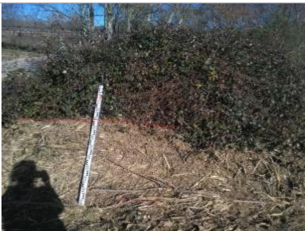
Laisse de crue dans la végétation

Altitude calculée de l'eau (en m) : 326.64 m