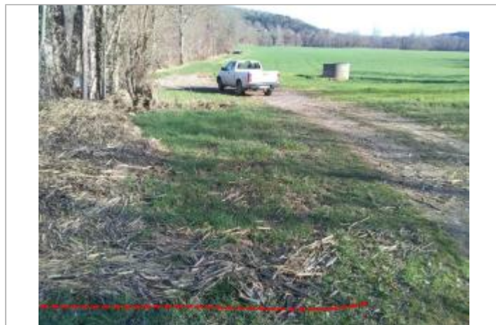
Chemin d'exploitation au bord de la D7

GÉOLOCALISATION Coordonnées WGS84 : X: 1.93396594 / Y: 43.03885720 Coordonnées RGF93 (Lambert 93) X: 613057.86 / Y: 6216091.13 Coordonnées RGF93 (ETRS89) : X: 1.9339659 / Y: 43.0388572 Code Hydro: O1--0290 Rive de référence: Gauche