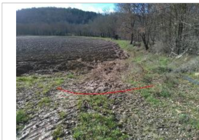
Débris végétaux au sol