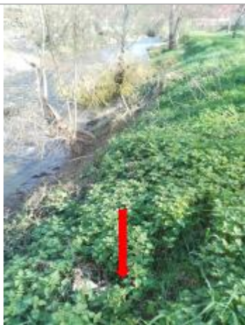
Débris végétaux en haut de berge