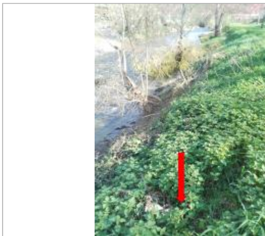
Berge rive gauche de l'Hers après la confluence avec le Chalabreil