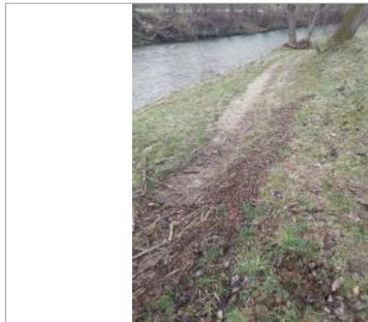
Bord de l'Hers en rive droite devant les jardins