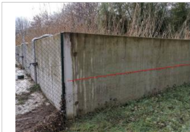
110 centrimètres de hauteur d'eau au niveau de la station d'épuration

Altitude calculée de l'eau (en m) : 368.99 m