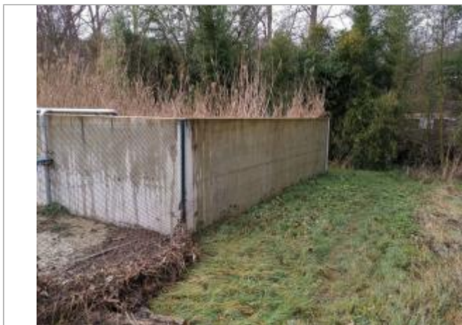
Station d'épuration de Chalabre