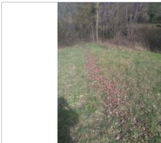
Prairie rive droite de l'Hers bord de la D16

Coordonnées WGS84 : X: 2.00621312 / Y: 42.99772850