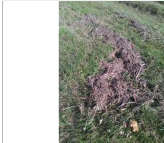
Champs rive gauche

Coordonnées WGS84 : X: 2.00131563 / Y: 42.99225800