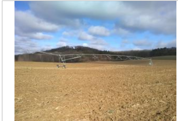
Champs rive droite - Photo ©AGERIN

Coordonnées WGS84 : X: 1.92466146 / Y: 43.09060900