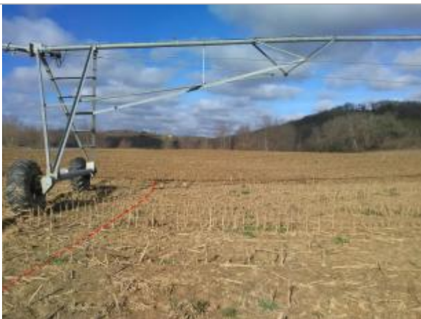
Témoignage agriculteur

Altitude calculée de l'eau (en m) : 307.63 m