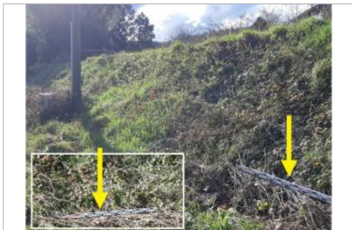
Laisse de crue au pied de la digue