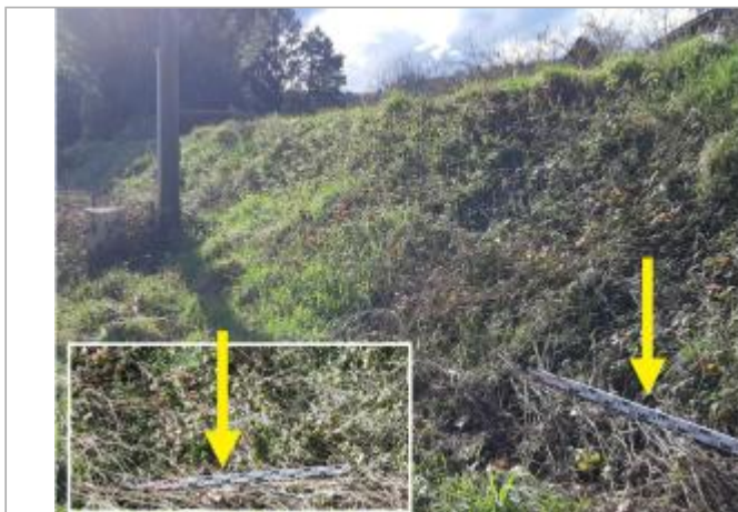
Digue au niveau de la rue du Moulin

Coordonnées WGS84 : X: 1.96829953 / Y: 43.02151230