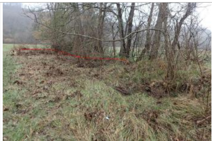
Débris végétaux talus

Altitude calculée de l'eau (en m) : 347.03 m