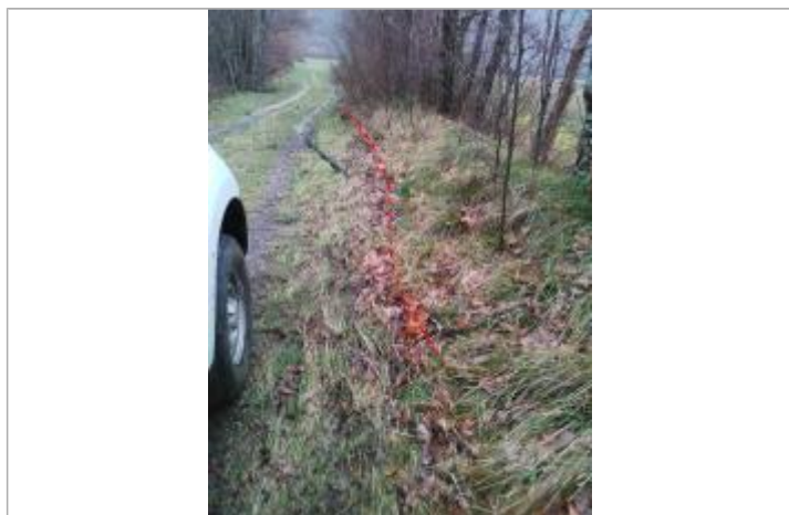
Débris végétaux talus - Photo ©AGERIN

Altitude calculée de l'eau (en m) : 347.07 m