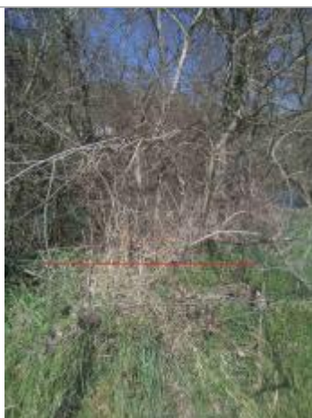
Débris végétaux berges - Photo ©AGERIN