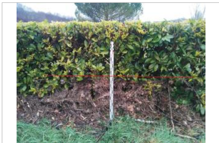
Débris végétaux haie