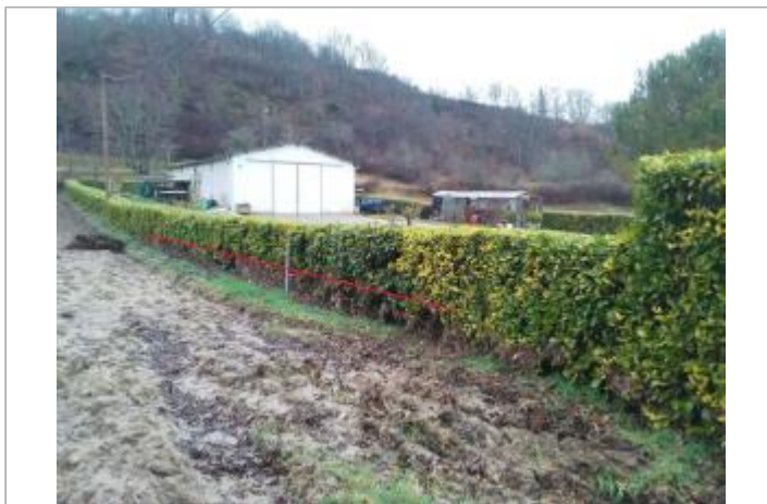
Haie Route Laspecho