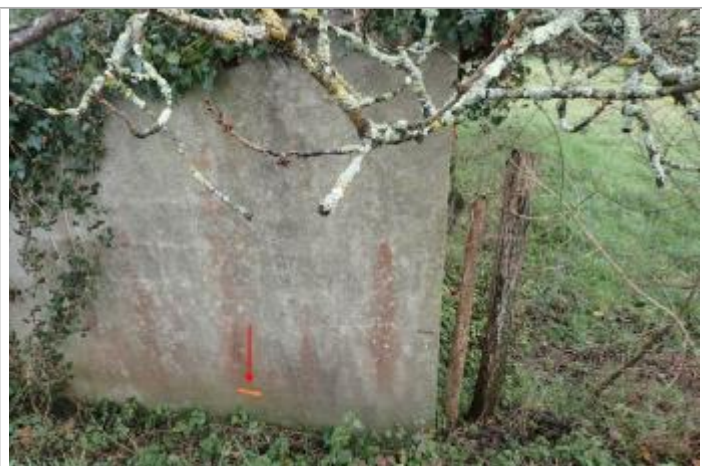
Trace peinture mur abri

Altitude calculée de l'eau (en m) : 343.28 m