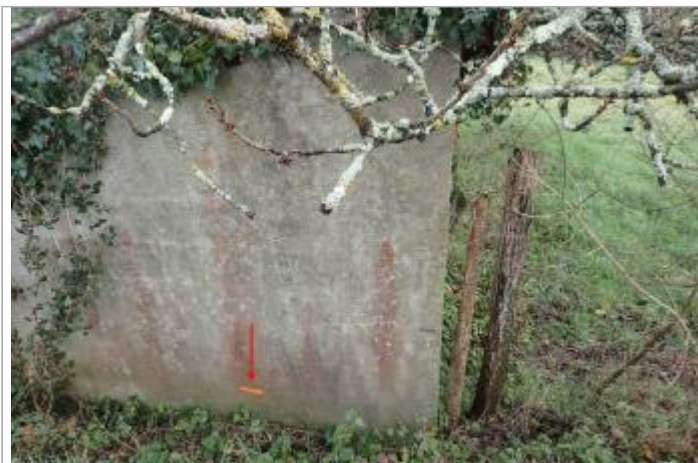
Abri jardin route de Léran