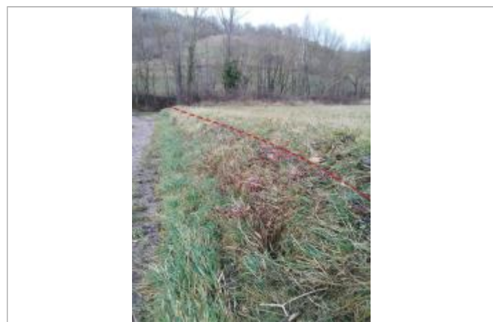
Débris végétaux talus