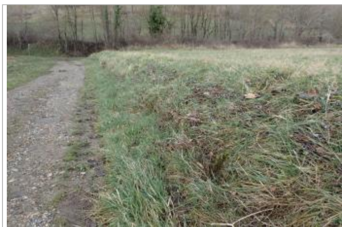
Champs rive droite - Photo ©AGERIN