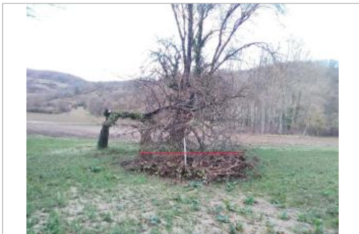
Arbre rive droite

Coordonnées WGS84 : X: 1.97123869 / Y: 43.02181900