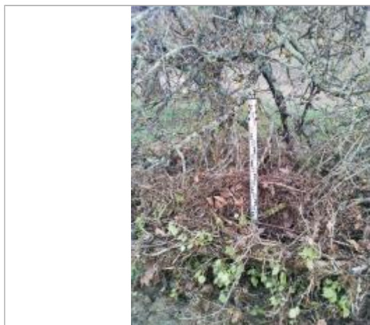
Débris végétaux arbre