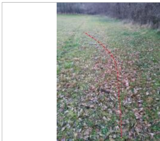
Débris végétaux au sol