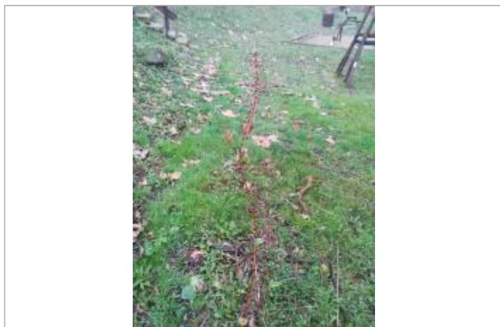
Débris végétaux sur sol

Altitude calculée de l'eau (en m) : 341.48 m