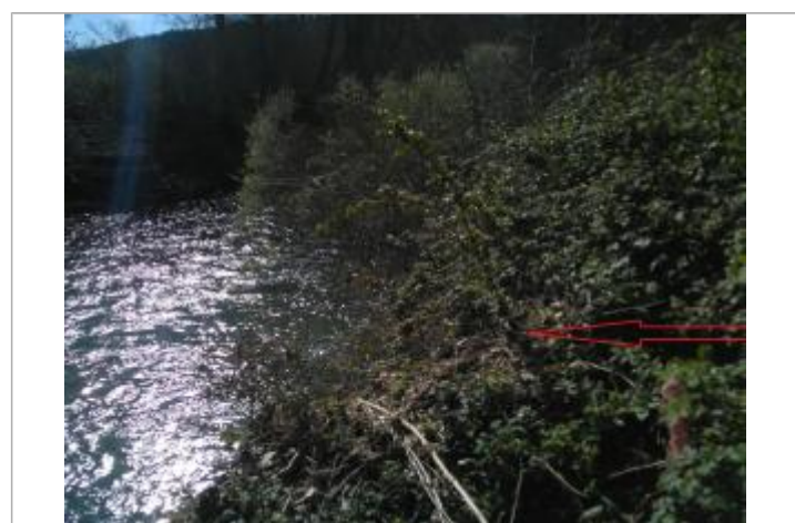
Débris végétaux sur végétation