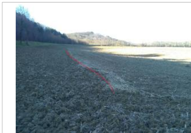
Débris végétaux sur sol

Altitude calculée de l'eau (en m) : 331.73 m