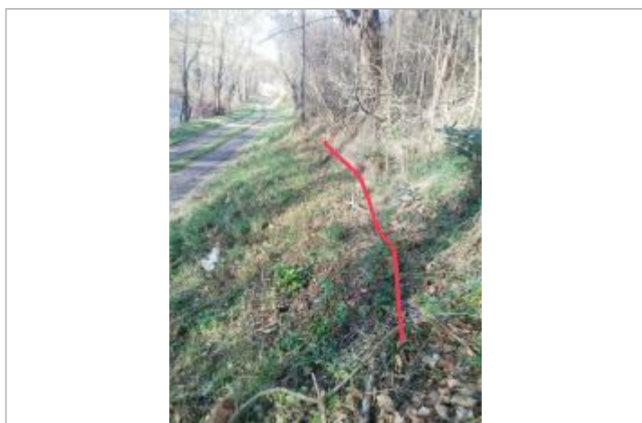
Débris végétaux digue

Code : GTL_R_9812_1 Date de mise à jour : 04/09/2020 Auteur : SPC GTL