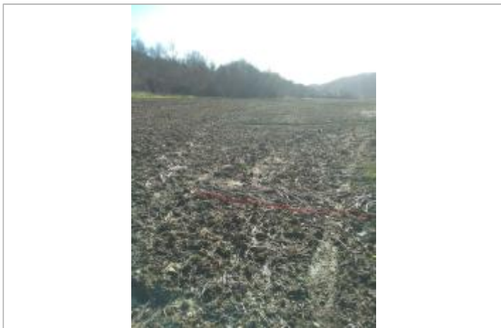
Débris végétaux sur sol - Photo ©AGERIN