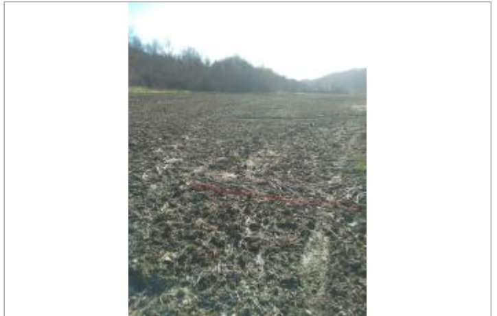
Champs rive droite