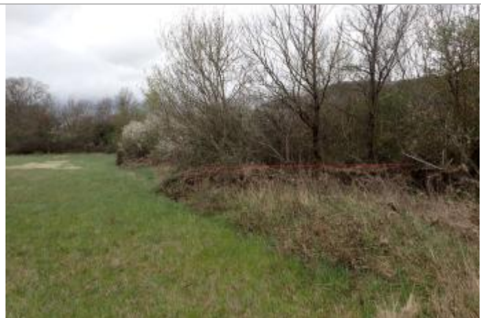
Débris végétaux sur végétation

Altitude calculée de l'eau (en m) : 287.28 m