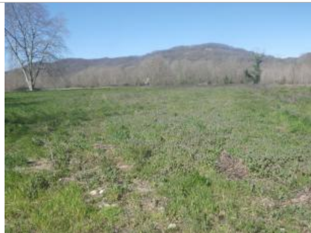
Rive gauche