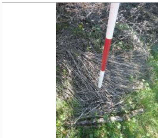
Débris végétaux sur sol