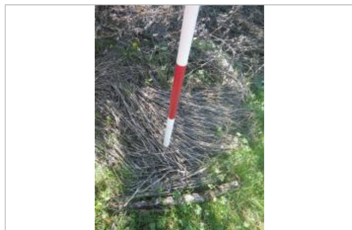
Débris végétaux sur sol