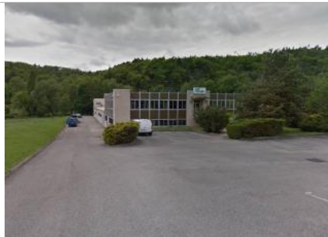
ZI Les Près du Roy - accès à l'arrière de l'entreprise (AC+)