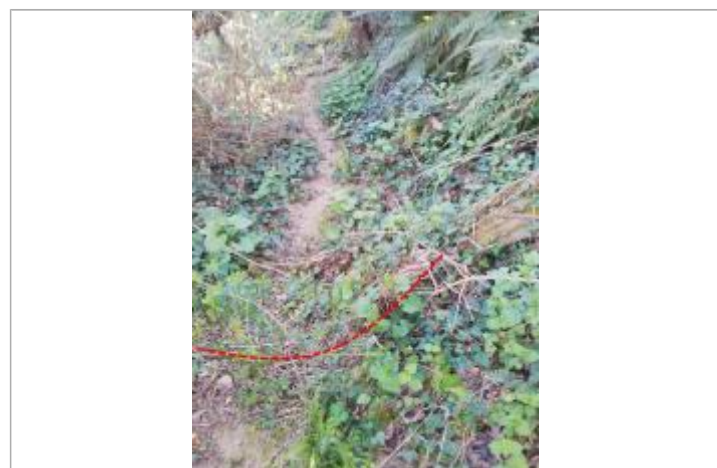
Débris végétaux sur berges