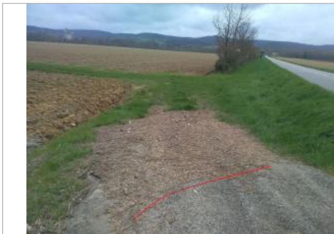
Chemin d'accès agricole au bord de la D206

Coordonnées WGS84 : X: 1.78416040 / Y: 43.08606320