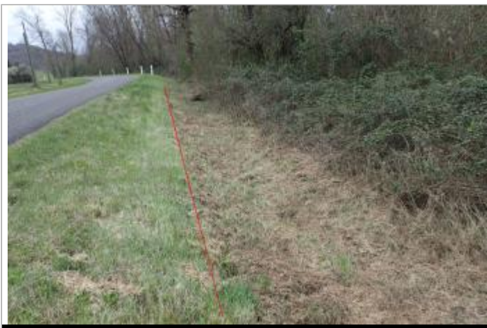
Bas côté de la D40

GÉOLOCALISATION Coordonnées WGS84 : X: 1.76791452 / Y: 43.09115310 Coordonnées RGF93 (Lambert 93) X: 599607.02 / Y: 6222102.06 Coordonnées RGF93 (ETRS89) : X: 1.7679145 / Y: 43.0911531 Code Hydro: O1--0290 Rive de référence: Droite