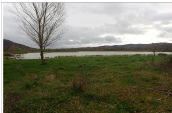
Bord de la sablière du lieu-dit Mondoune

GÉOLOCALISATION Coordonnées WGS84 : X: 1.79632637 / Y: 43.08344160 Coordonnées RGF93 (Lambert 93) X: 601908.83 / Y: 6221209.06 Coordonnées RGF93 (ETRS89) : X: 1.7963264 / Y: 43.0834416 Code Hydro: O1--0290 Rive de référence: Droite