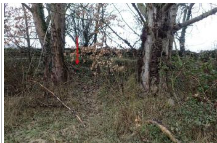
Digue proche de la station d'épuration de camp Limoux

GÉOLOCALISATION Coordonnées WGS84 : X: 1.98304854 / Y: 43.01138240 Coordonnées RGF93 (Lambert 93) X: 617021.3 / Y: 6212983.68 Coordonnées RGF93 (ETRS89) : X: 1.9830485 / Y: 43.0113824 Code Hydro: O1--0290 Rive de référence: Droite