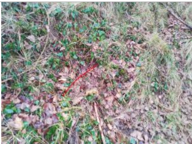
Débris végétaux en haut de digue

Altitude calculée de l'eau (en m) : 354.4