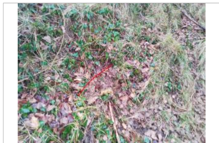
Débris végétaux en haut de digue

GÉNÉRAL Code : GTL_R_10014_1 Date de mise à jour : 21/09/2020 Auteur : SPC GTL