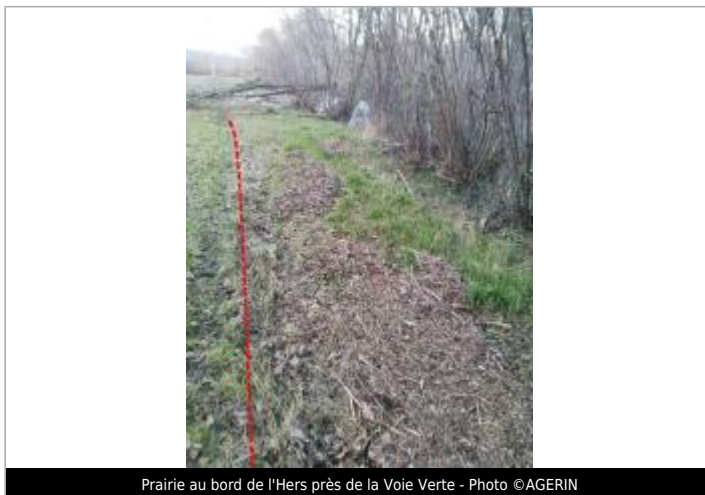
Prairie au bord de l'Hers près de la Voie Verte