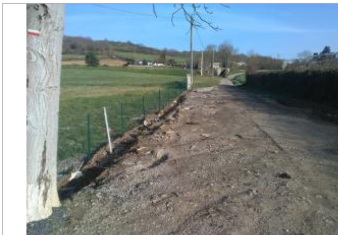
Grillage station de captage