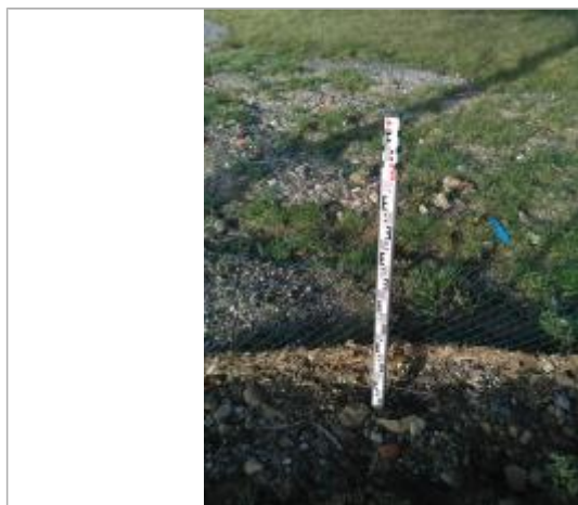
Laisse d'inondation sur le grillage