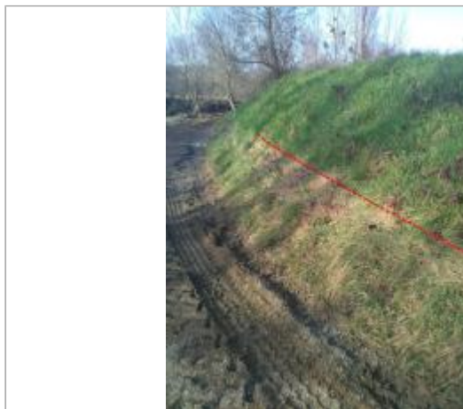
Digue derrière la station de pompage