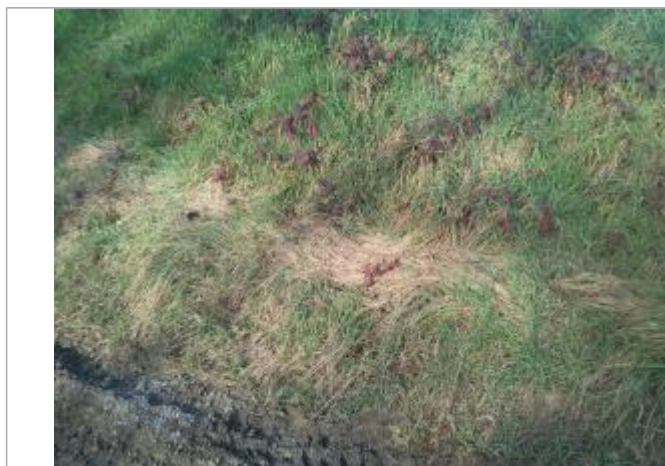
Laisse d'inondation sur la digue