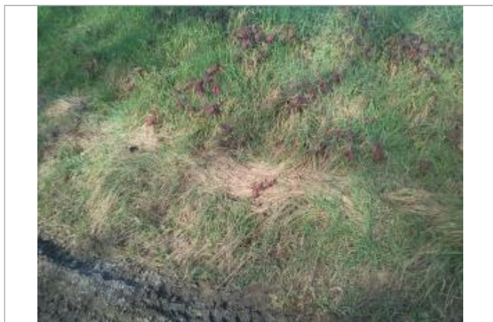
Laisse d'inondation sur la digue

Altitude calculée de l'eau (en m) : 356.98