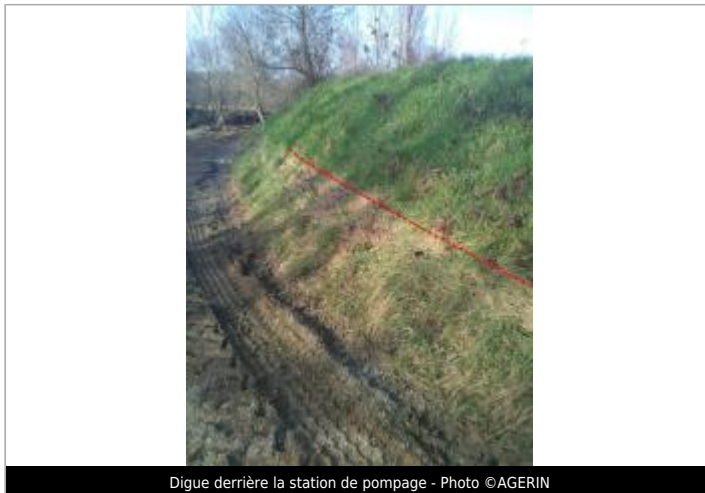
Digue derrière la station de pompage