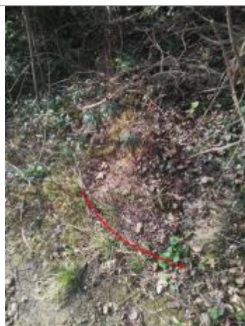
Débris végétaux en haut de berge