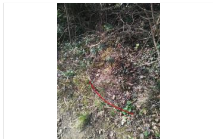
Débris végétaux en haut de berge