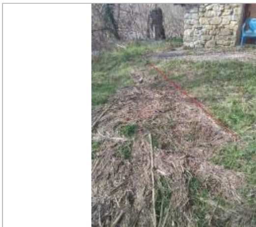
Cabanon proche D16

Coordonnées WGS84 : X: 2.00632280 / Y: 42.99992000