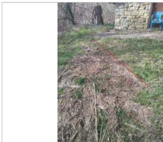
Débris végétaux au sol