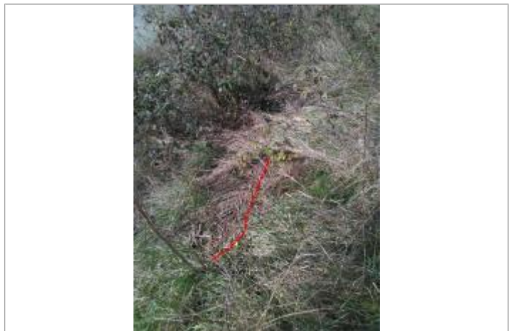
Débris végétaux en haut de berge

GÉNÉRAL Code : GTL_R_9992_1 Date de mise à jour : 10/10/2021 Auteur : SPC GTL