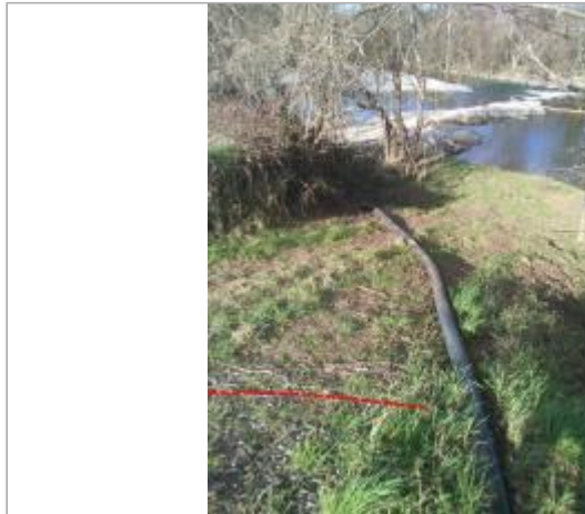
Accès au seuil de Roumengoux

Coordonnées WGS84 : X: 1.93450841 / Y: 43.08149890